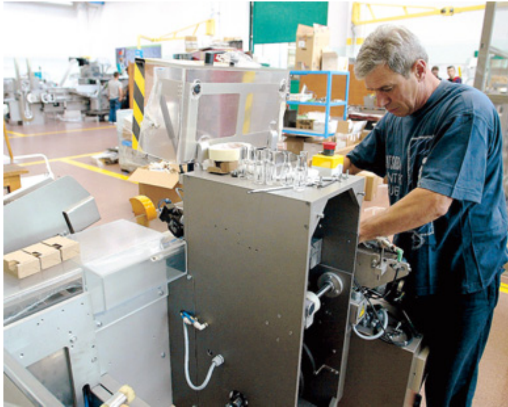
Un operaio al lavoro. Le imprese vengono aiutate a istituire un sistema di gestione della sicurezza completo

Alle imprese è richiesto un sistema di gestione e tutela dei lavoratori che prevede miglioramento continuo e controlli